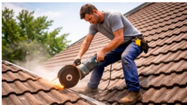
Gefahren in einem Bild oder Video zu entdecken schult das Gefahrenbewusstsein.

Bereiten Sie kurze Ausschnitte aus frei zugänglichen Videos (z. B. YouTube) oder Bildern vor, in denen handwerkliche oder technische Arbeiten gezeigt werden. Zeigen Sie die Clips zunächst kommentarlos. Wenn Sie Zugang zu einem KI-System zur Erzeugung von Bildern oder Videos haben, können Sie gezielt Materialien erstellen lassen, die genau auf Ihre Betriebssituation zugeschnitten sind.