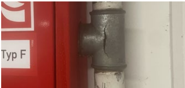
Kleiner Riss mit großer Wirkung.

Im Normalzustand ist eine trockene Steigleitung drucklos. Sie wird erst bei einem Brandereignis durch die Feuerwehr über einen Außenanschluss mit Wasser gefüllt. Kommt es beim Befüllen zu einem Riss, ist der Druckaufbau in der Leitung nicht mehr gewährleistet. Die Folgen sind unmittelbar: Ausströmendes Wasser flutet nicht vorgesehene Bereiche, während in den oberen Geschossen nicht ausreichend Löschwasser ankommt. Trupps in bereits verrauchten Stockwerken haben dann nicht genug Löschmittel. Das Leck bedeutet damit einen gefährlichen Zeitverlust für die Feuerwehr, der ihre Einsatzfähigkeit massiv einschränkt.