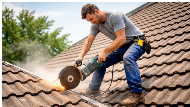
Gefahren in einem Bild oder Video zu entdecken schult das Gefahrenbewusstsein.

Bereiten Sie kurze Ausschnitte aus frei zugänglichen Videos (z. B. YouTube) oder Bildern vor, in denen handwerkliche oder technische Arbeiten gezeigt werden. Zeigen Sie die Clips zunächst kommentarlos. Wenn Sie Zugang zu einem KI-System zur Erzeugung von Bildern oder Videos haben, können Sie gezielt Materialien erstellen lassen, die genau auf Ihre Betriebsituation zugeschnitten sind.