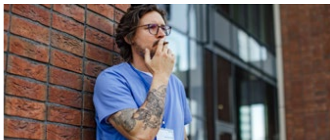
Während der Raucherpause besteht kein Versicherungsschutz.

In den meisten Fällen wird damit in Arbeitsverhältnissen nur ein Gleichgewicht zwischen den nicht rauchenden und den rauchenden Mitarbeitern wiederhergestellt.