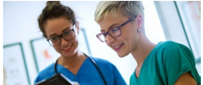
Job-Sharing in der Pflege: Abstimmung für einen reibungslosen Arbeitsalltag.

§ 13 II TzBfG die Kündigung der anderen Arbeitnehmer nicht zulässig. Eine Änderungskündigung zur Anpassung der notwendigen Arbeitszeit ist zulässig.