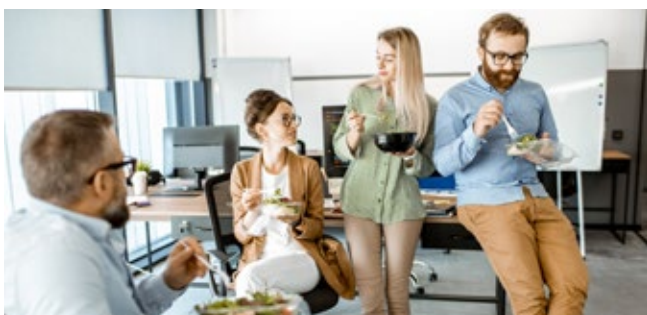
Keine neue Erkenntnis, aber wichtiger denn je aufgrund regelmäßiger Alleinarbeit im Homeoffice: Das soziale Miteinander fördert das Wohlbefinden am Arbeitsplatz.